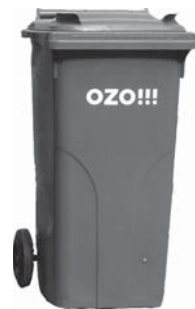
popelnice na zeleň 120 l a 240 l

(biologicky rozložitelný odpad ze zahrad - tráva, listí, plevel, rostlinné zbytky)